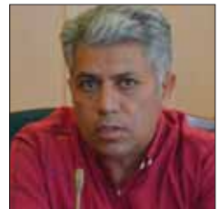
زحمتکش، دبیر هنر کرج

نوروزی: بزرگ‌ترین آسیبی که به درس هنر در این چند سال وارد شد این است که متأسفانه تدریس هنر را به مدیران و معاونان دادند که ۶ ساعت یا ۱۲ ساعت مدیران موظف هستند در هفته تدریس کنند